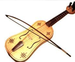
La vièle à archet