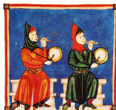
La flûte à 3 trous et le tambourin