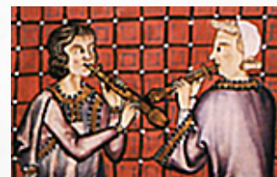
La chalemie (anche double)